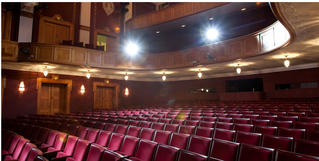
Ronja Røverdatter skal spille på Odense Teaters Store Scene, hvor der er plads til 483 tilskuere.

Når I har bygget kulissen, skal I præsentere den for klassen. I skal forklare klassen, hvorfor I lavet en kulisse af Mattisskoven, som I har. Du skal sammen med din læsemakker sætte ord på, hvad Mattisskoven betyder for Ronja og Birk. Måske overvejer du samtidig, hvad skoven betyder for dig.