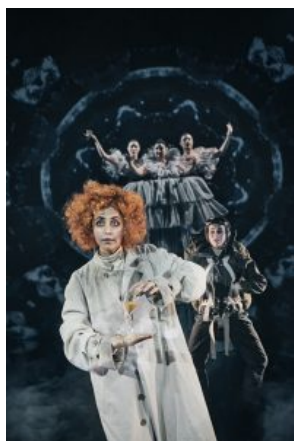
Momo med Cassiopeia og Tidstanterne

Lykken varer kun, til grå agenter melder sig og overbeviser om, at man kunne nå meget mere, hvis man holdt op med at spille sin tid på at hygge sig sammen. De grå agenter er lette at kende. De ryger alle cigaretter(!), men tager man dem fra den, fordamper de. De kan også fortrylle folk, så de glemmer, at de eksisterer.