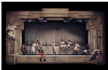
Momos amfiteater

Odense Teater er i vinterferien ekstraordinært børnevenligt. Ikke bare genoptager man på Store Scene den henrivende 'Mille og den grimme ælling' i hele vinterferien samt lørdage og søndage indtil 3. marts, men frem til 23. marts kan man se 'Momo og tidstyvne' på teatrets Odeonscene.