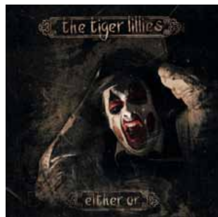
The Tiger Lillies har udgivet en cd med sangene fra THE EITHER/OR CABARET "Either Or"