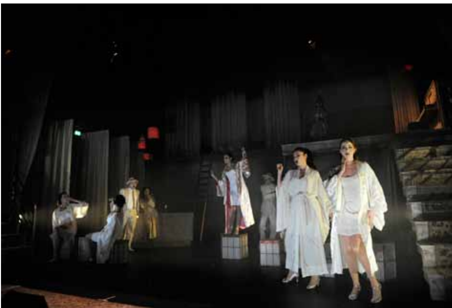
Foto fra prøverne til THE EITHER/OR CABARET

Vi er overbeviste om, at de livskommentarer, som er så typiske for Kierkegaards filosofi, vil virke lige så naturlige i de sammenstød, som vil opstå imellem det æstetiske og det etiske i en confuciansk sammenhæng som i den gængse kristne.