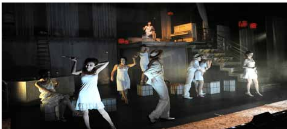
Foto fra prøverne til THE EITHER/OR CABARET

Kierkegaard, The Tiger Lillies og dansk scenekunst er for mig at se den helt rigtige kulturelle blanding at samarbejde med kineserne om.