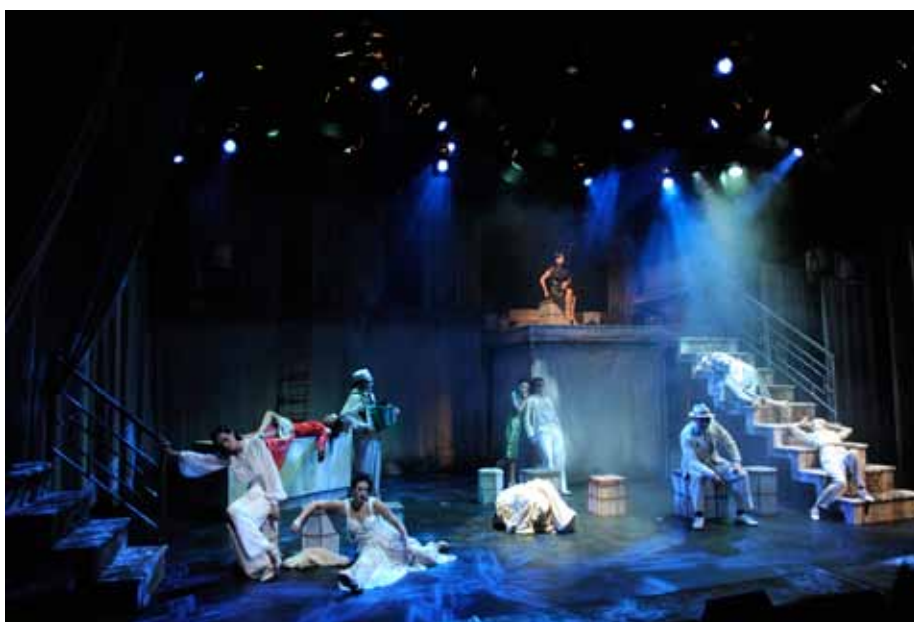
Foto fra prøverne til THE EITHER/OR CABARET

”Jeg har været i Kina og se på scenen hvor forestillingen skal spille. Den er såmænd ikke så forskellig fra Sukkerkogeriet. Desuden har jeg valgt meget lette stoffer, så de kan transporteres til Kina uden at det koster en bondegård. Og de tungere ting som plateauerne, trapperne og barerne som de skal kopiere på teatret i Shanghai er forholdsvis enkle at bygge - der er ikke så meget der kan misforstås. Tegningerne og fotos af scenografien er sendt til teatret i Shanghai. Jeg er lidt spændt på om de har en god teatermaler derude der kan lave patineringen - det er sådan set min største bekymring, udover lyset, som også vil være svært at få kopieret, med andre og færre lamper og kort indrykningstid. Og scenografien er helt afhængig af godt, varieret og præcist lys.”