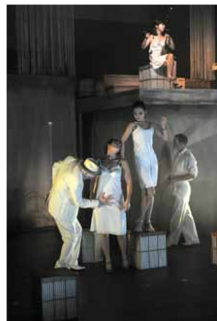
Foto fra prøverne til THE EITHER/OR CABARET

Kierkegaard er en af vores helt store tænkere og forfattere, han er samtidig med H. C. Andersen, der er kendt af de fleste kinesere. Kierkegaard har 200 års fødselsdag i 2013 – og ligesom Andersen er han universel og tidløs - og derfor god at lytte til, fortælle om og være stolt af. Vi må jo finde det tunge skyts frem, når Danmarks 5.5 mio. mennesker skal måle sig med Kinas 1.4 mia.